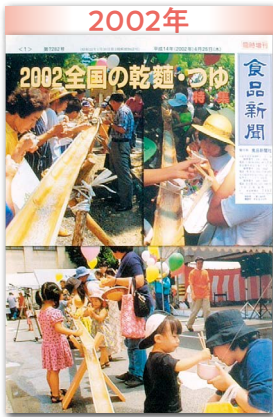
機械麺、予想外の健闘 手延べ増産で生産量増やす