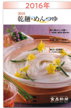
個人戦から、共闘へ 「存在感」「優位性」発信の時