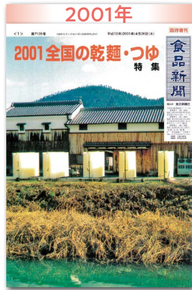
「暑い夏」効果みられず 6年連続して下降線