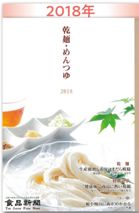
生産微増も市況はまだら模様 “満足感”“メニューの豊富さ”がカギ