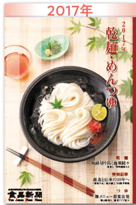
販路切り拓く施策続々 減産も特殊麺増える