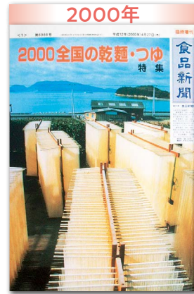
手延べの大幅減が響く 関連業界と共闘急務