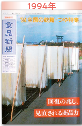
回復の兆し ギフトを含め1,500億円規模