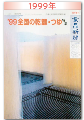
4年ぶり微増の大健闘 そば粉加工停滞市場に活