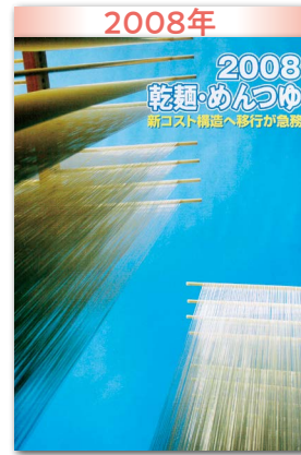
一変した原料事情 窮状下で新構築の好機