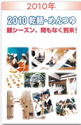
乾麺業界正念場“元年” PBや留型が席卷