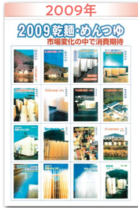
今春は好発進 価格要因と消費期待