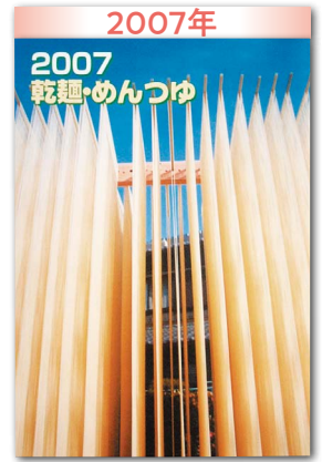
「値上げの秋」へ始動期 市場縮小、再生産に不安感