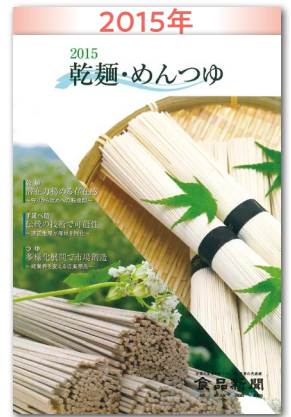
潜在力秘める存在感 守りから攻めへの転換期